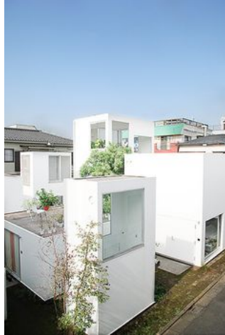
Moriama House Ryue Nishizawa, SANAA