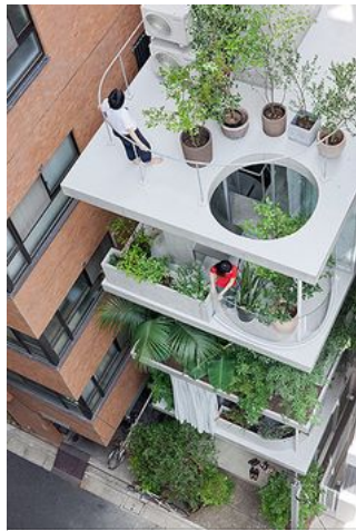
The House and Garden Building, Tokyo. Designed by Japanese architect Ryue Nishizawa. The house has no facade and no interior walls. Instead there are floor-to-ceiling windows, curtains and an array of plants that define boundaries between spaces. Private residence.