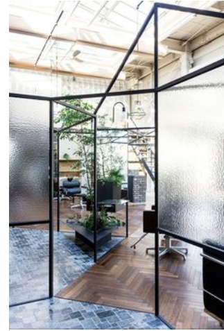
Vision Atelier by Takehiko Nez