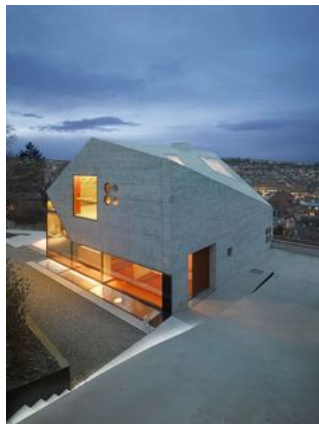
haus 36 -- mba/s