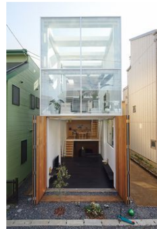
house in kawasaki, 川崎の住宅