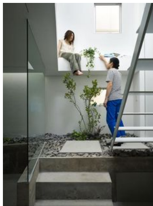
Moriyama House - SANAA