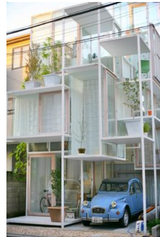
you saw the model, now you see the real House NA, Sou Fujimoto Architects, Tokyo